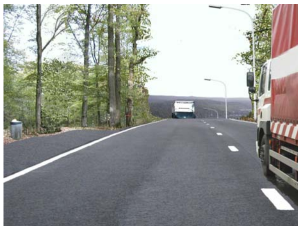
Photo-montage : Promenade Reickem - implantation du tracé "Reickem" (contournement nord)