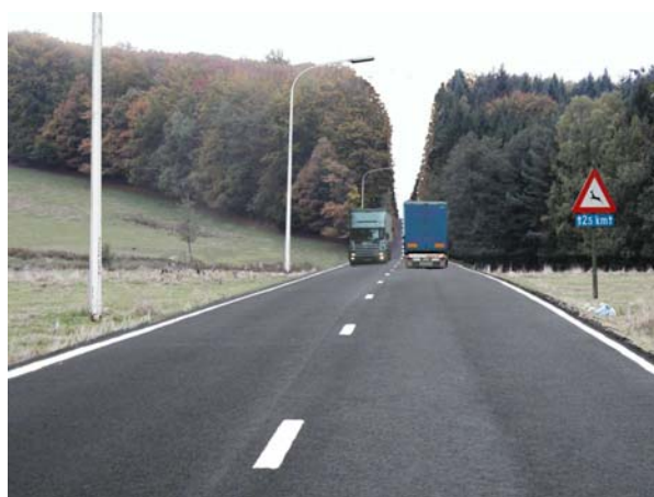
Photo-montage : Pré du cerf (Frahinfaz) - implantation du tracé "Reickem" (contournement nord)